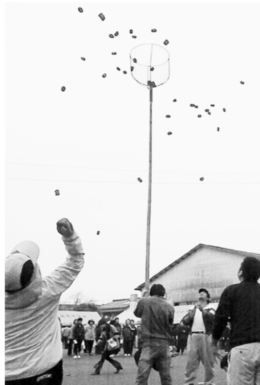
盛り上がりを見せた玉入れ大会

賞四十点、二等賞五十点、三等賞六十点を選定しました。それぞれの部門で入賞されたものは、土づくりなどの基本技術の励行に努力された結果だと推察します。今後益々研鑽を積み、消費者に喜ばれる農産物・加工品の生産を行っていただき、ここに参集された方も、これらの農産物をぜひ参考にしていただきたいと思います。百五十点の入賞者に賞品授与を行いました。また、本年度も果樹協議会・園芸部会・稲作部会・女性部・青壮年部・和牛部会・年金友の会の各部長賞を設け、表彰を行いました。各支部とも更なる品質向上を目指し、これからも安全・安心な農産物