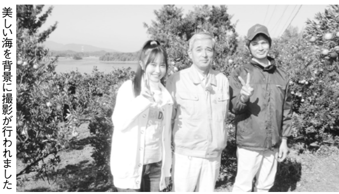
美しい海を背景に撮影が行われました

害もなく外観もきれいでおいしく仕上がっています。皆さん、ぜひ一度ご賞味ください。