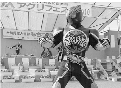
仮面ライダーはちびっ子に大人気!

生産に努めてまいります。最後に、アグリフェスタ二〇の開催にあたり、組合員の皆様には多数ご観覧を賜り誠にありがとうございました。また、関係者の皆様には最後までご協力いただき、厚く御礼申し上げます。