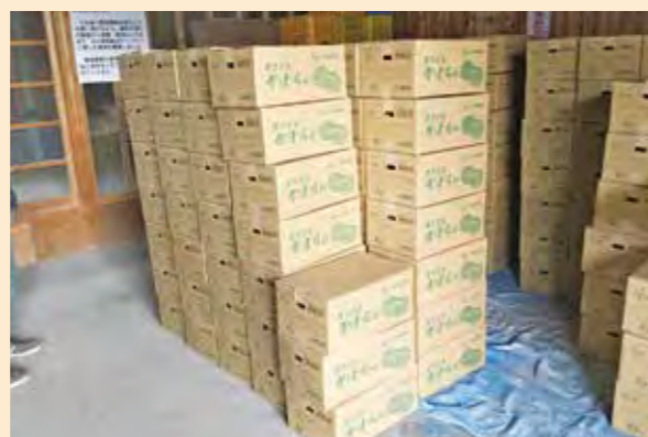
箱詰めされた秋カボチャ

れましたが、ややバラツキがあったものの管理の徹底により生育も順調に進みました。箱詰めされたカボチャはJAへ出荷され関東地方の市場へ送られます。