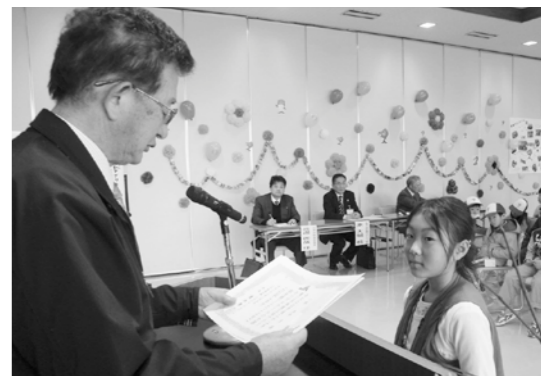
蓮池校長より卒業証書が手渡されました

んが「稲刈りで初めて鎌を使って難しかったけど慣れてくるとスパッと切れました。その後のカレーが今までで一番美味しかったです。食べ物を作る大変さが分かりました。食べ物を大切にします。また参加したいです」と、一年間の感想を発表しました。