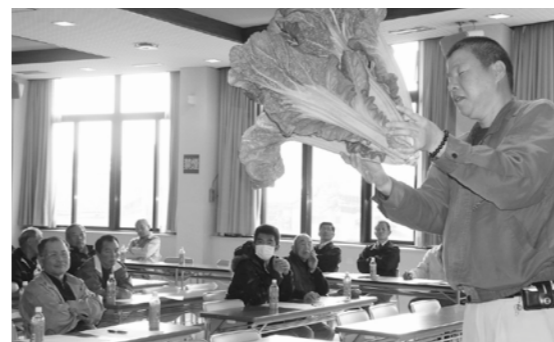
吉本指導員によるタカナ作りの説明

く、生産目標は、作付面積一、七〇〇アール、生産量は約六〇〇tで安定供給を目指します。