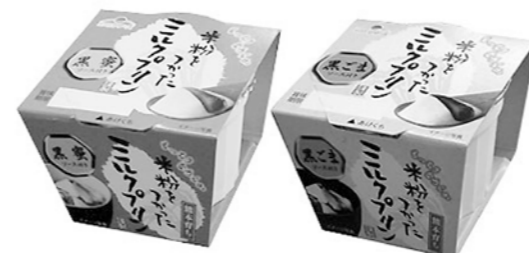
米粉ミルクプリン (黒蜜) 米粉ミルクプリン (黒ごま)

まず、ミルクプリンをひとつくち、次にソースをかけてお召し上がりいただくのがおすすめです。ぜひ一度お試しください。