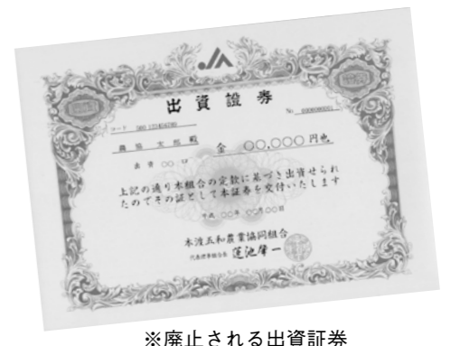
※廃止される出資証券