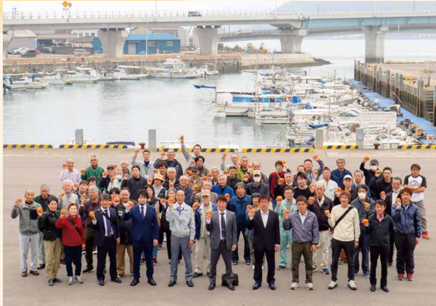
果樹生産者の皆さん