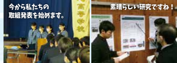
【ステージ発表の様子】 【ポスターセッションの様子】